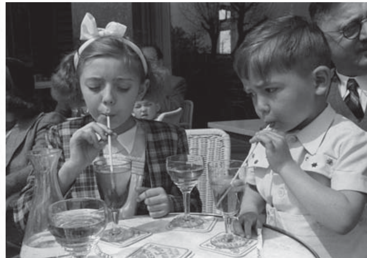
Op der Terrass vum Pôle Nord, 1947