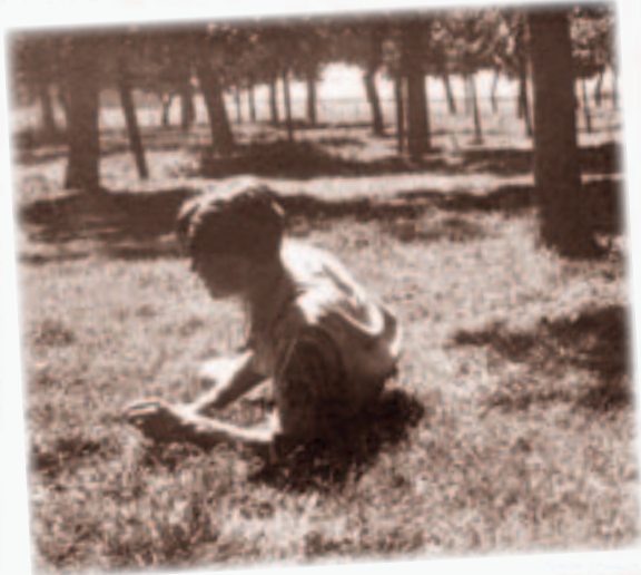
Eng kleng Rascht am Bongert nom Mëttegiessen