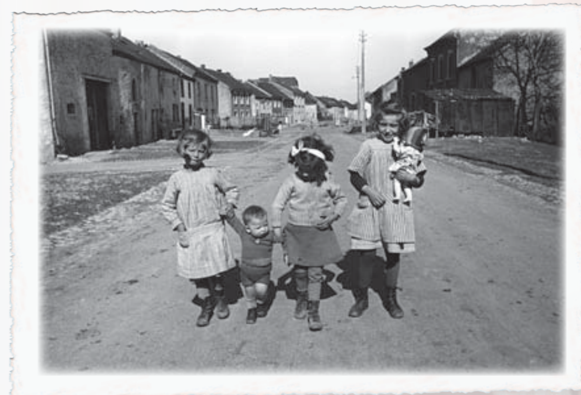
D'Popp ass iwwerall matgeholl ginn

Am Krich war et en Trouscht fir d'Kanner, wann se hir léifste Spillsaach konnten derbäi hunn. Bei Fligeralarm ass och am Keller gespielt ginn.