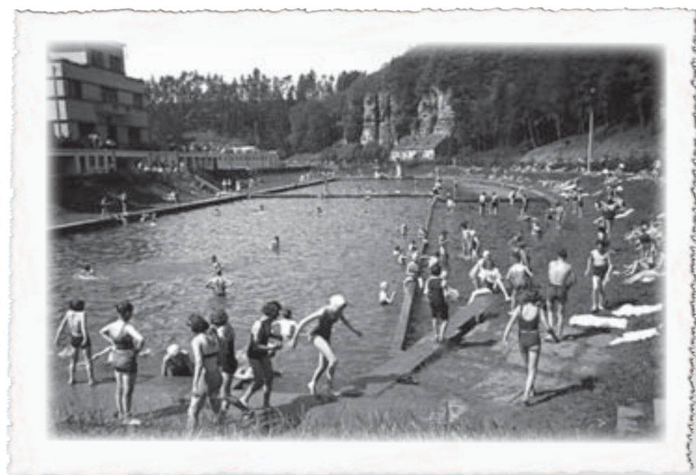
D'Schwämm op der Gantebeensmillen, 1941