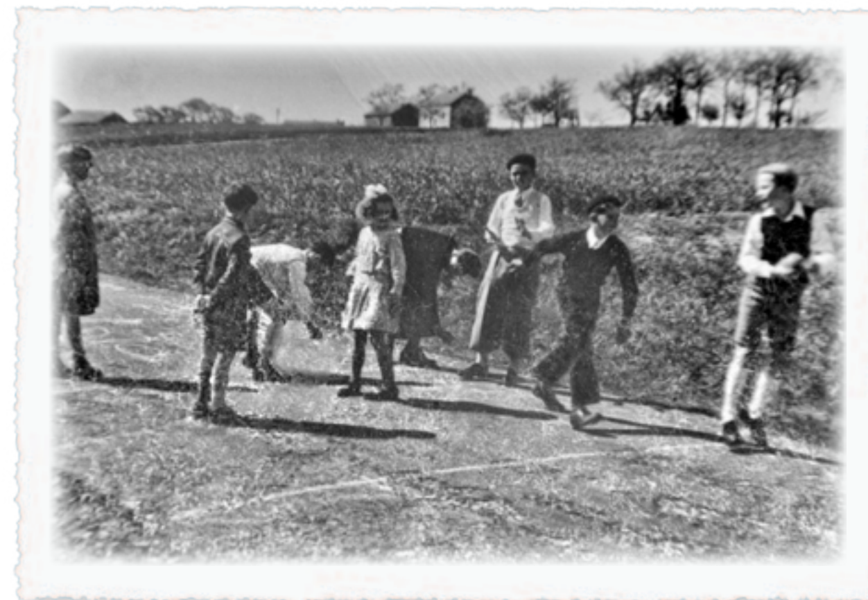
Déi Hämmer Kanner hu sech vill Spiller ausgeduecht