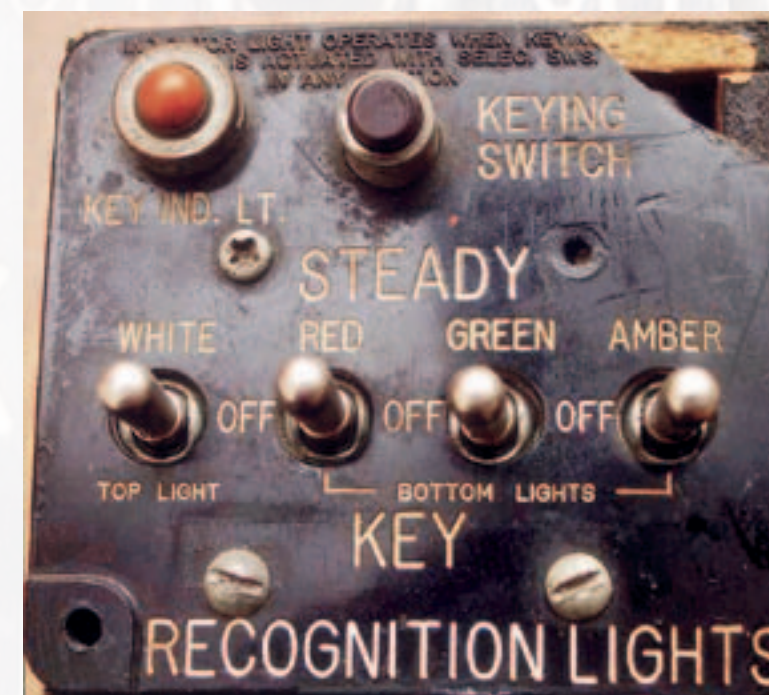
E Cockpit-Schalter, e flott Relikt fir ze spielen