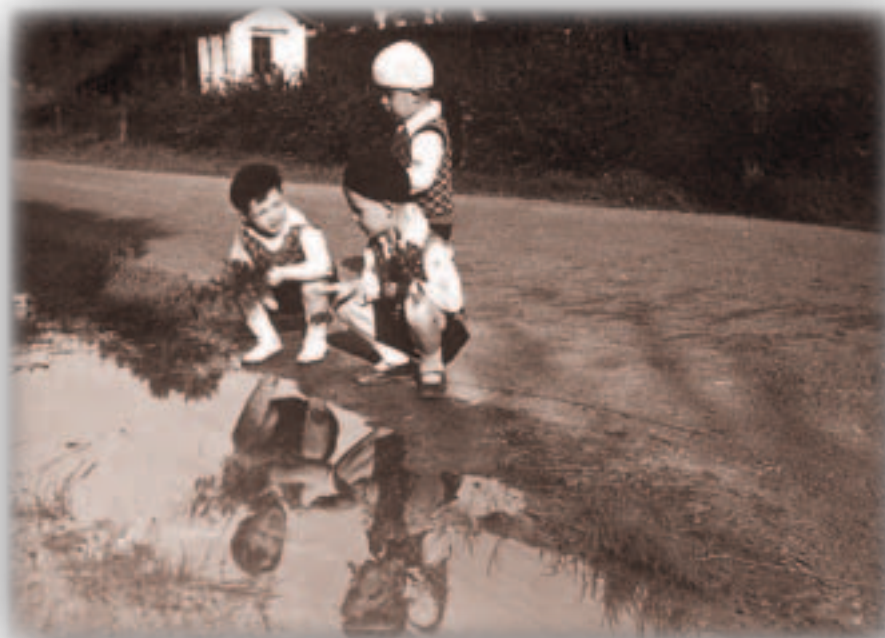
Um Fetschebur hunn déi Hämmer Kanner gär am Waasser gepuddelt

Cousins ermunterten mich zur Ausführung des großartigen Einfalls. Gemeinsam suchten wir einen geeigneten dünnen Pappelast als Manövrierstange. Damit mühte ich mich vorerst ab, vom äußersten Rand des vollgefüllten Teiches eine Scholle ans Ufer zu ziehen. Dabei kam mir das Lied vom Knäblein in den Sinn, das am Weiher steht und leise zu sich spricht: „... Ich muss es einmal wagen, das Eis, es muss doch tragen, wer weiß, wer weiß, wer weiß“.