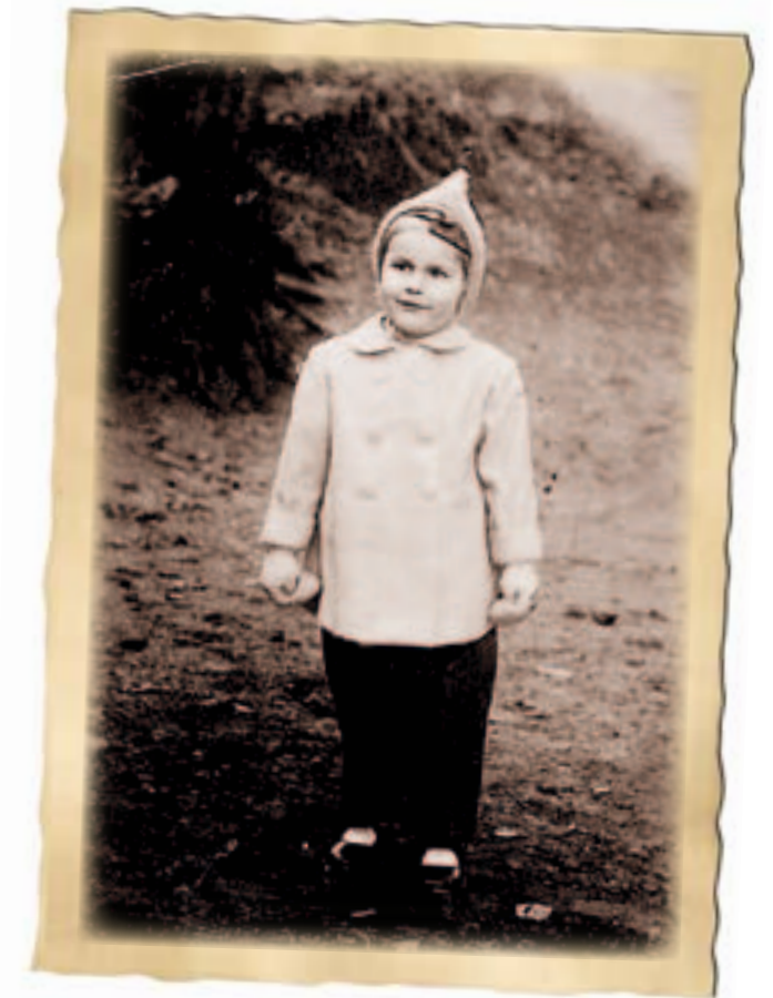
Eng vun dëse schéine Moulen ass am Zwergelach verschwonnen