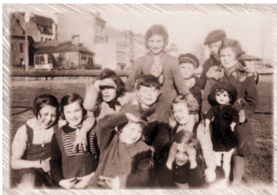
Kanner aus dem Neiewee zu Réimech um ale Fussballsterrain, 1940