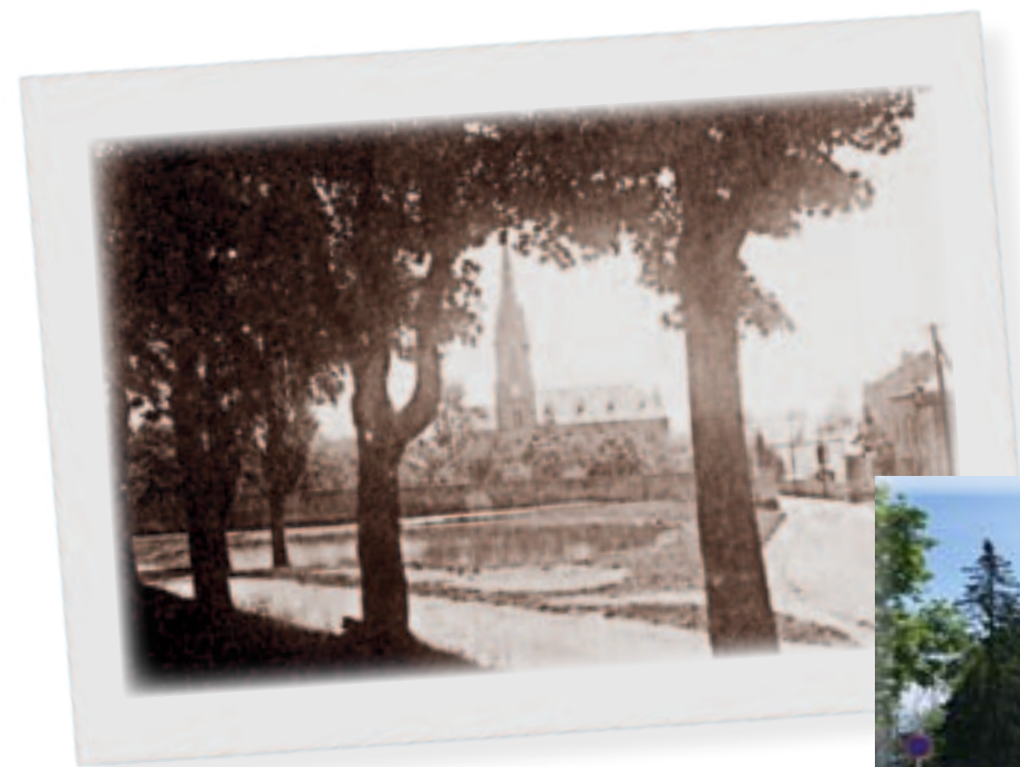
Den Hämmer Pull, fréier an haut

Wenn abends die Kuhherde vom Laangfeld von der Weide heimkehrte und die ganze Straße einnahm, galt der Teich als Ersatz für die fehlende Dorftränke. Ich hatte vor diesen dickbäuchigen Biestern eine Heidenangst, wenn sie mit ihren