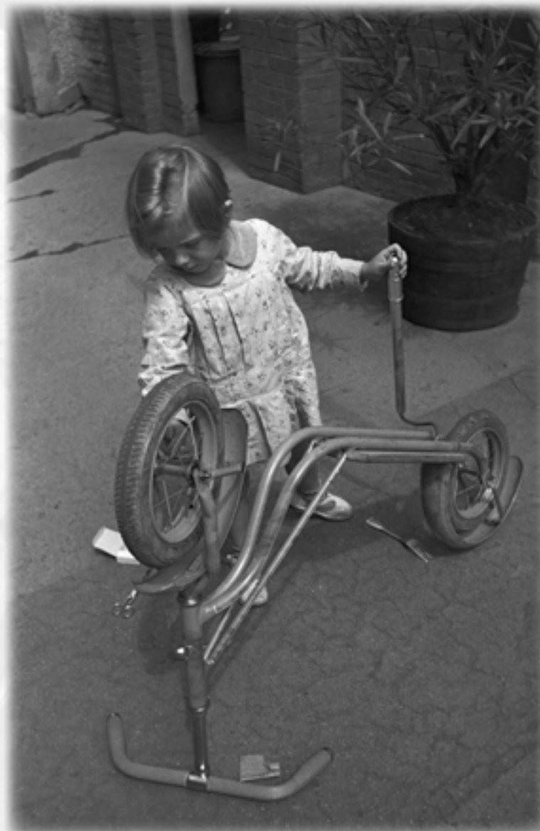
Déi eng hunn sech eleng ëm hir Trottinette gekëmmert ...

D'Kanner si stonnelaang dobausse gelaf an hunn zesumme gespillt.