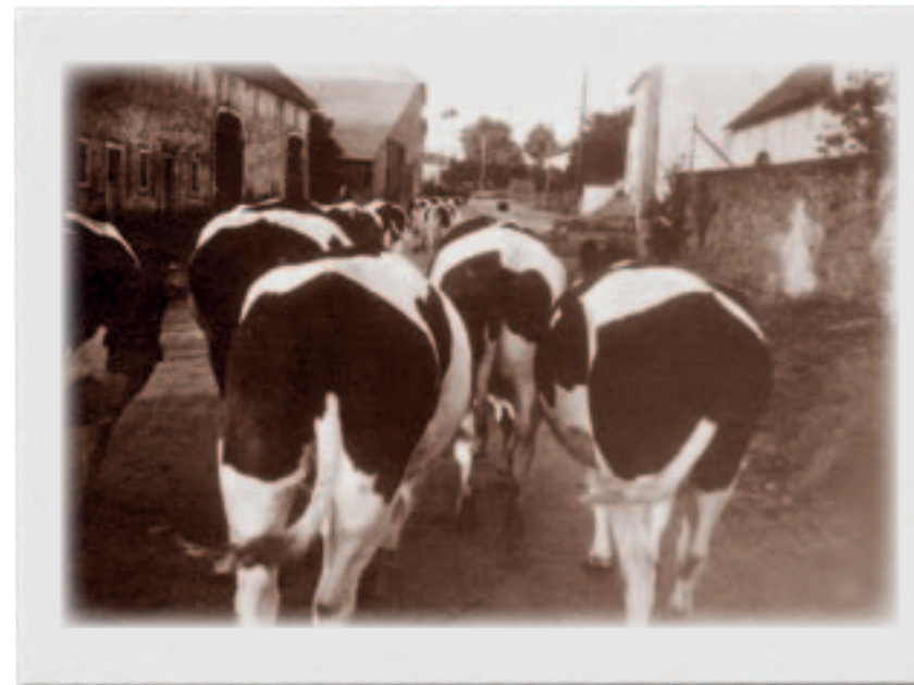
Moies op d’Weed an owes erëm heem: d’Kéi hunn de Wee gutt kannt

Auf der Weide „Auf Utsched“ wurde ich in die Pflichten des Hütens in den Grenzen des 150 x 150 Meter großen Feldes eingewiesen und ermahnt, dass keinem Wiesennachbar auch nur ein Grashalm von seinem Grummet abzuweiden sei.