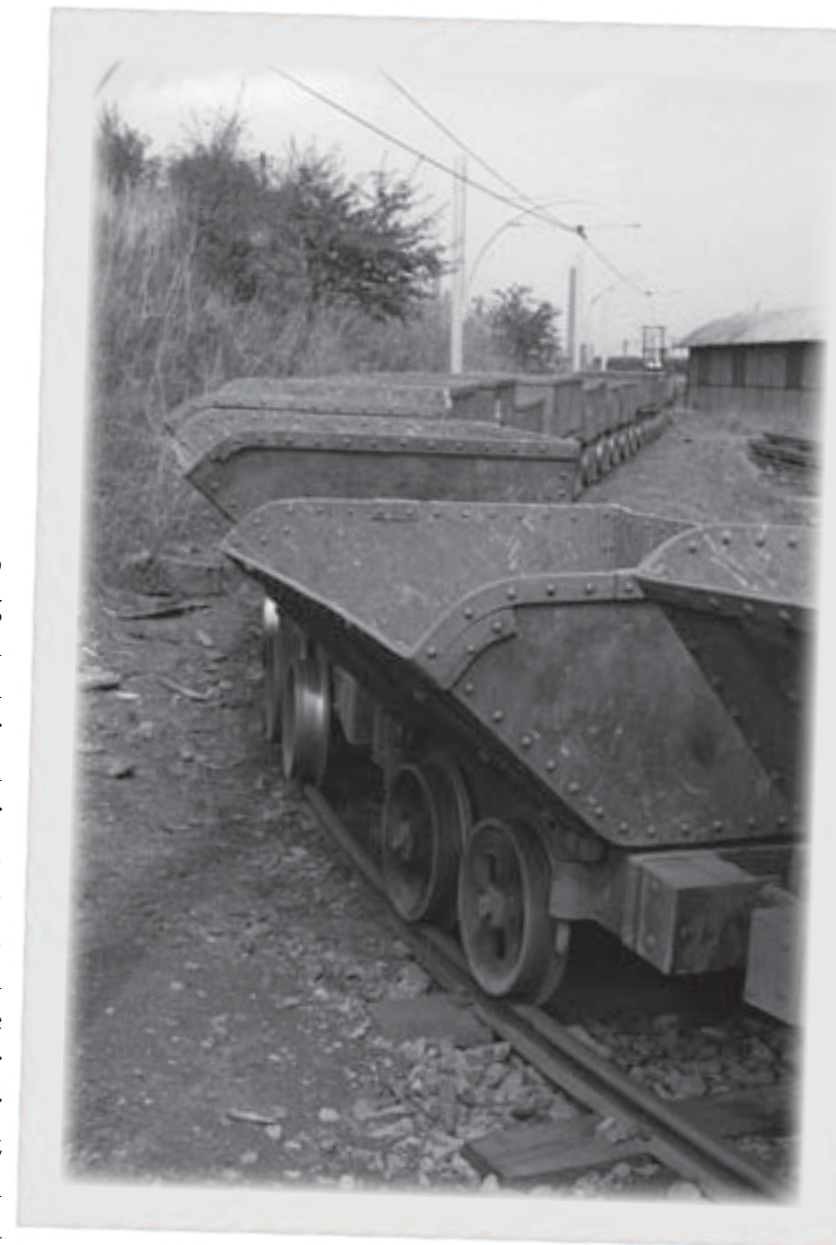
An dëse Buggie goug et mat Karacho de Bierg erof