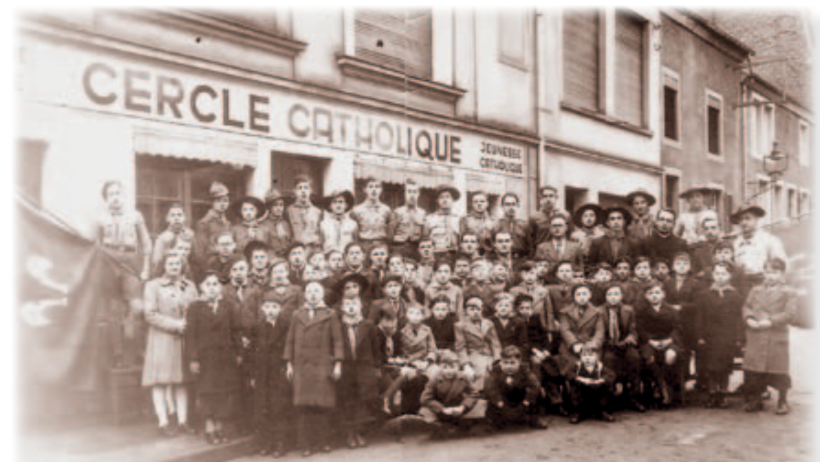
Déi Déifferdenger Scouten 1946

Éisleker sinn an de Minett komm an eng nobel Missioun vun de Scoute war fir hinnen ze hëllefen. Mat Weenercher si mer Kleeder sammele gaangen, mer hu gehollef si iergendwéi ënnerdaach ze kréien an eist Scoutshome war de ganze Wanter mat Flüchtlinge beluegt. Mer hunn am Opdrag vun der Déifferdenger Gemeng d'Heizung am Veräinshaus gemaach, gebotzt a reparéiert.