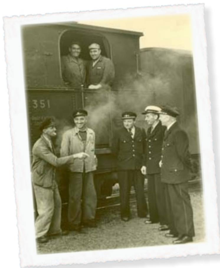
D'Equipe vum Jangeli

Oflenkunge goufen et och genuch, wann, am Wéngert oder am Bongert gehollef gouf.