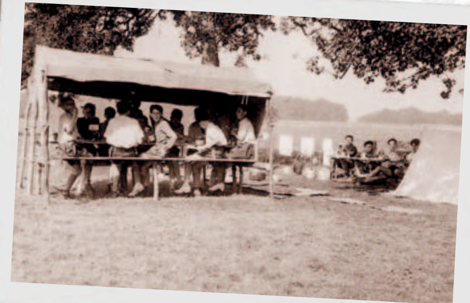
Déi Réimecher Scouten