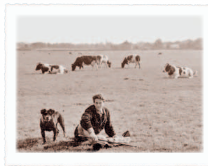
De Bobby stung dem Ferdy trei zur Sait