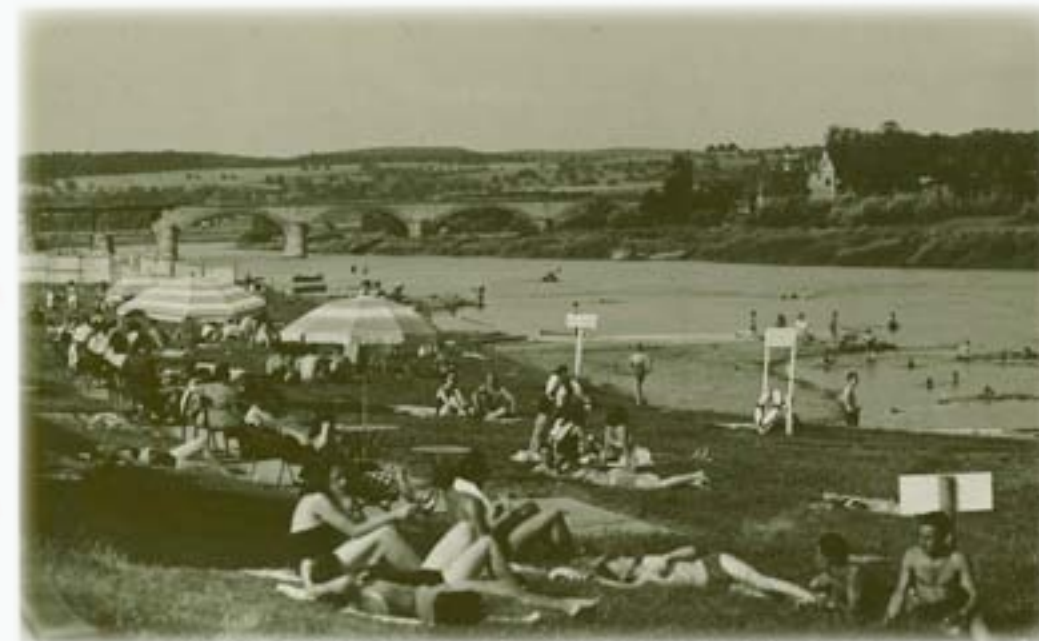
E waarme Summerdag nom Krich an der Réimecher Schwämm. Am Hannergrond déi provisoersch, reparéiert Bréck

Sou wäit wéi ee Buedem kritt huet, woar d’Musel mat Holzstämm ofgedeelt. Rechts eng Trap fir an den Dëmpel, do woar