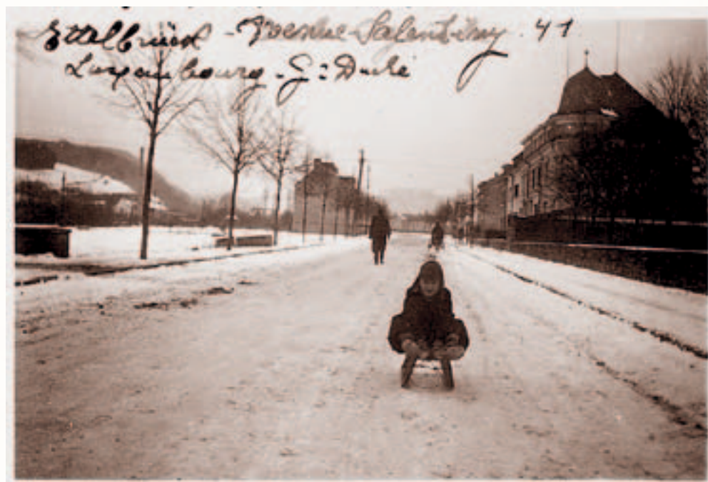
De Paul Wallers um Schlitt an der Avenue Salentiny zu Ettelbréck, 1941

Mir hate Rollschong mat bleche Rieder, déi e schreckleche Kaméidi gemaach hunn. Doriwwer waren d'Nopere guer net begeeschtert, wa mir een hannert deem aneren domat biergof iwwert den Trottoir gerannt sinn.