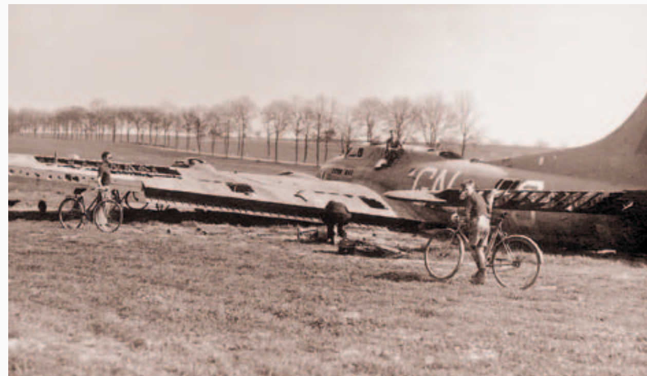
Bauchlandung vun enger B17 um Findel: dat wollten d'Jongen sech natierlech net entgoe loossen

* „Ten-in-one food parcels“ waren amerikanische Rationspakete, die eine Mahlzeit für 10 Soldaten beinhalteten.