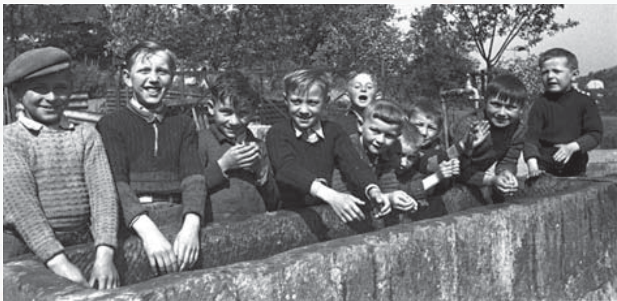
D'Lausbouwe vun Nidderdonwen beim Wäschbur

Et war normal, datt d'Kanner doheem gehollef hunn: am Stot oder am Gaart a besonnesch um Land, wou vill vun hinnen an engem Baueren- oder Wënzerbetrib opgewuess sinn. Mä och beim Schaffen hunn se sech Spiller a Spiichten ausgeduecht.