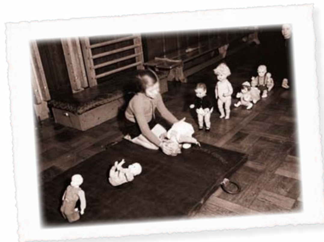
Soll bei dese ville Poppen och eng „Schildkröt“ derbäi gewiescht sinn?